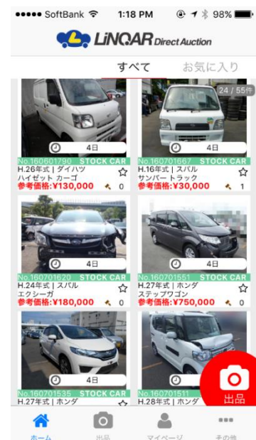
スマートフォンオークションページ

お客様からのお問い合わせ先: 電話:050-3386-8847 メール:info@e-dreamer.co.jp